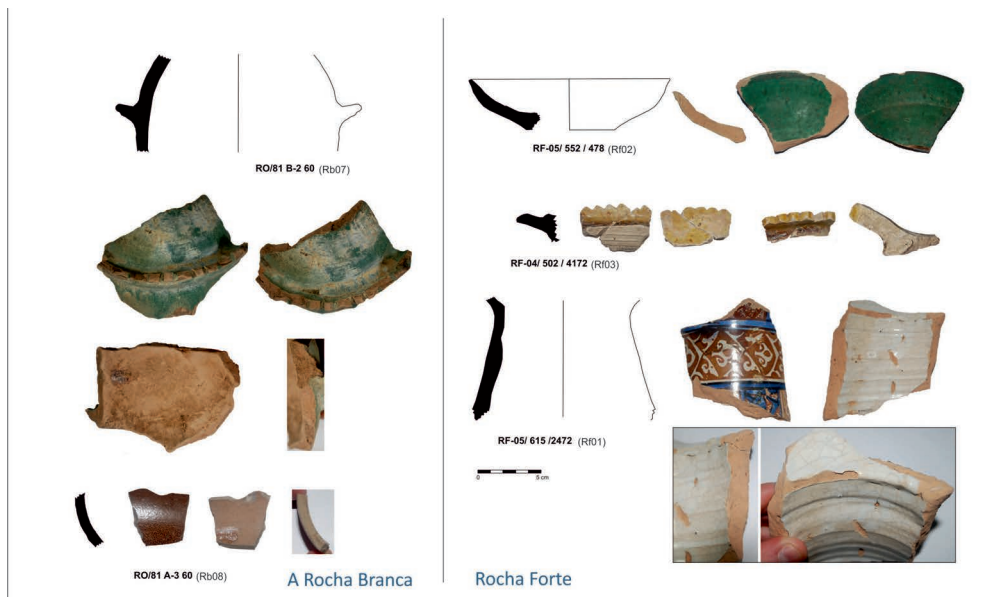
Fig. 2. Fotografía de los fragmentos analizados.

El vidriado, amarillo, posee una costra gris cuarteada en la mayoría de su superficie. Se trata de un vidriado plomado con pequeñas cantidades de calcio e hierro, éste último incorporado, posiblemente, como colorante. La costra se caracteriza por estar enriquecida en silicio y empobrecida en plomo y hierro. Se trata pues de una alteración superficial del vidriado por pérdida de plomo y hierro, similar a la encontrada en RF02. Otras partes del vidriado son marrones, se caracterizan por tener en algunas zonas un mayor contenido de calcio y en algún caso presencia importante de bario, y mucho menos silicio. Probablemente la menor concentración de silicio la causa de la tonalidad marrón, por un efecto de menor dilución del colorante.