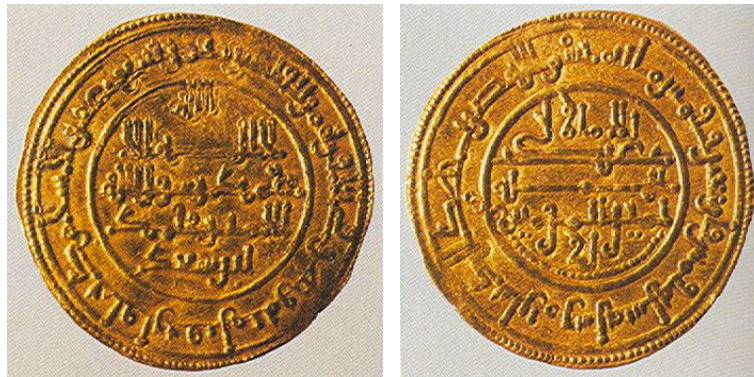
Figura 2: Dinar Ceca Murcia, 554 hégira

Dihrem , en lo que han dado en llamarse sistemas bimetálicos (como antaño lo fue el romano) que exigían una relación estable de cambio o equivalencia entre ambos metales.