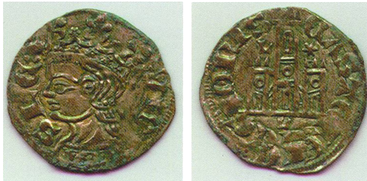
Figura 7: Cornado Alfonso XI León. Museo de León, Junta de Castilla y León, nº 1992,15,IV-225

La llegada al trono de Enrique II, y sobre todo la guerra civil entre petristas y trastamaristas (1366-69) que se saldó con la muerte de Pedro I a manos del propio Enrique II en los campos de Montiel, trajo un marasmo monetario a Castilla que no se conocía desde los tiempos de Alfonso X, siendo en nuestra opinión una de las cuatro grandes crisis con brutales quiebras monetarias de León y Castilla a lo largo de los siglos medievales, a saber: