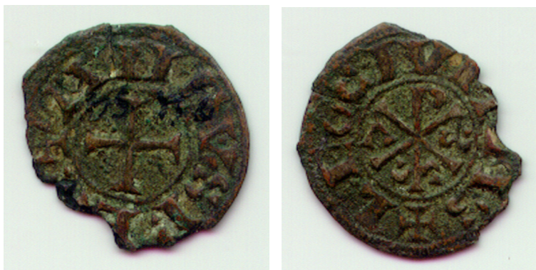
Figura 1: Obolo de Vellón (divisor del dinero) acuñado por Alfonso VI en León ca. 1080