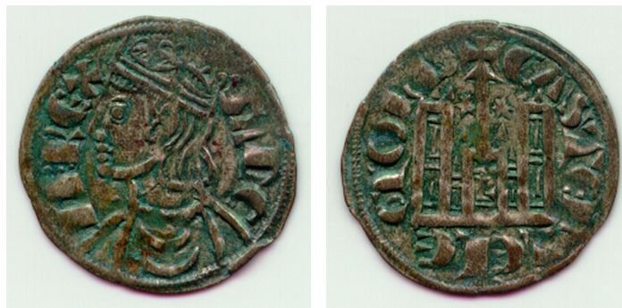
Figura 6: Sancho IV Cornado, anverso y reverso ceca de León. Museo de León, nº 1992-15,II,64

Siguiendo el hilo de nuestro discurso, podemos decir que a pesar de su excentricidad en el espacio unificado de León y Castilla, cada vez más amplio por los avances de la reconquista y la reunificación, sí conserve un cierto protagonismo desde finales del XIII y principios del XIV, buena prueba de ello es su activa presencia en las hermandades de las minorías de Fernando IV y Alfonso XI: Diversas villas leonesas participan en la hermandad leonesa de 1282 con Sancho IV, en la de las Cortes de Valladolid de 1295, en la hermandad leonesa de seguridad de 1312, en una hermandad política sumamente restringida con los infantes don Juan y don Felipe en 1313 -con tan solo León, Zamora, Astorga, Benavente y Mansilla- y en la general de 1315 (Fuentes Ganzo 1998c).