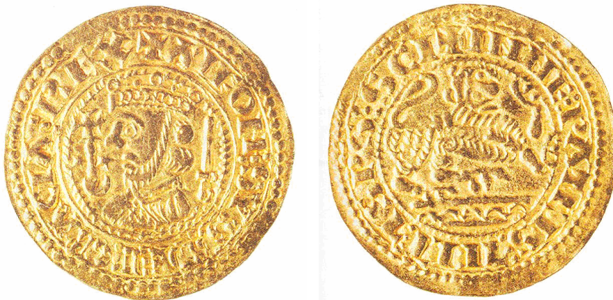
Figura 4: Anversos del maravedí de oro de Alfonso IX de León

nº inventario 1973/24/17005.