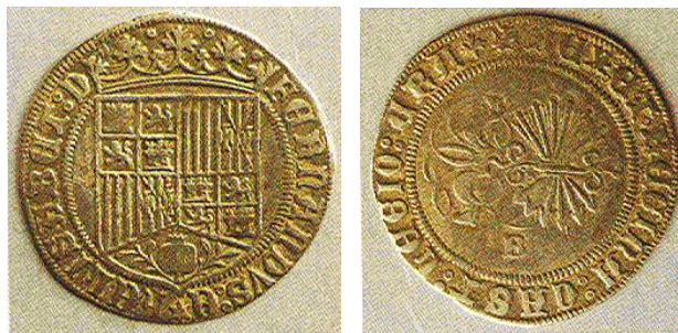
Figura 9: Real de Plata, de los Reyes Católicos, posterior a la Pragmática de Medina del Campo. Acuñada en Burgos "B", circuló en León con posterioridad a la pragmática. Museo de León, nº Inventario 2462

Para el metal argénteo mantendrán el real (tallando 77 piezas por marco), pero cambiando la tipología con el simbolismo del Yugo y las flechas entrelazados en su anverso y fundiendo en reverso en un escudo integrado las armas de Castilla y Aragón, que acababa con el tipo del primer real que acuñaron, indudablemente "medieval", que labraron con heráldica de un reino en anverso y del otro en reverso: " i que en los reales se ponga de una parte nuestras armas reales (ya unificadas) e de otra las devisas del yugo de mi la reina i la devise de las frechas de mi el rey ".