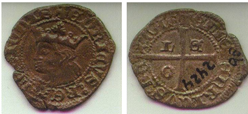
Figura 8: Cruzado 1369-70 valor 1 maravedí. Acuñado en León: L/E/O/N. Museo León, n° Inventario: 2424b

Además en el tiempo de Enrique II se crearon nuevas monedas, fundamentalmente el cruzado en 1369 al que en principio se dio un valor de un maravedí.