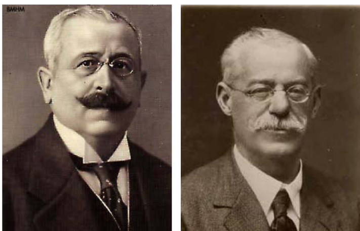
Figura 2. Los catedráticos Peregrín Casanova (izda.) y Odón de Buen (dcha.) destacaron por su defensa de las teorías darwinistas.

Todos ellos, y muchos más, son buenos ejemplos de personalidades científicas notables que participaron, de una forma más o menos activa, en la difusión de las ideas del biólogo británico. También merece la pena destacar, en las décadas finales de la centuria, la adhesión al darwinismo por parte del muy polémico Odón de Buen (1863-1945) ( Figura 2 , derecha), catedrático en la Universidad de Barcelona, cuya defensa de las ideas de Darwin le supuso la separación de la cátedra en 1895, decisión que produjo en la ciudad catalana unas revueltas estudiantiles que provocaron el cierre del centro universitario durante dos meses. También se adhirieron a las teorías del inglés Eduardo Boscá Casanoves (1844-1924), profesor de Historia Natural en diversos centros de Enseñanza Media, Blas Lázaro e Ibiza (1858-1921), uno de los botánicos españoles más eminentes, Romualdo González Fragoso (1862-1928), considerado el Padre de la Micología española, etc.