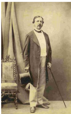
Figura 1. Antonio Machado y Núñez, catedrático de Historia Natural en la Universidad de Sevilla, fue uno de los primeros difusores del darwinismo en España.

En un primer momento, algunos casos aislados son la excepción del "silencio" general sobre las teorías de Darwin. Así, el catedrático de Mineralogía y Zoología en la Universidad de Valencia, Rafael Cisternas Fotseré (1818-1876), tuvo una gran influencia en la difusión del darwinismo en la ciudad del Turia, de manera semejante a la que logró el catedrático de Historia Natural de la Universidad de Sevilla, Antonio Machado y Núñez (1815-1896), abuelo de los hermanos poetas ( Figura 1 ).