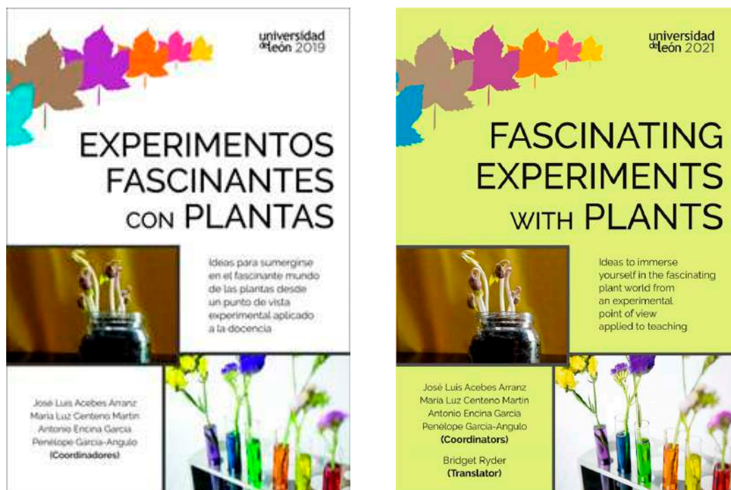
Figura 2. Portadas de los libros “Experimentos fascinantes con plantas” (2019) y “Fascinating experiments with Plants” (2021).

en su elaboración participaron activamente alumnos de los grados de Biología y Biotecnología bajo la supervisión y coordinación de uno de los miembros del GID. Todos los alumnos participantes en la elaboración de alguno de los capítulos figuran como coautores de la publicación.