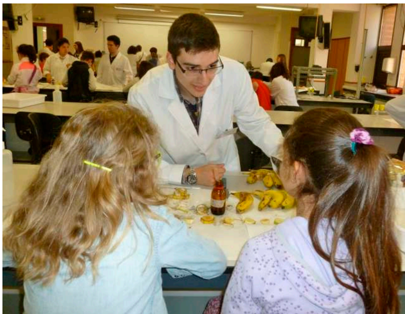
Figura 1. Celebración de uno de los talleres del Día Internacional de Fascinación por las Plantas.