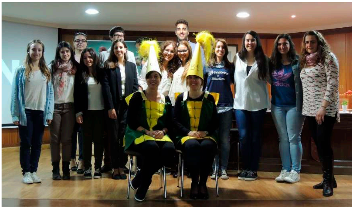
Figura 3. Profesoras y alumnos de Biotecnología que participaron en la puesta en escena de “Historia de la Biotecnología Vegetal”.