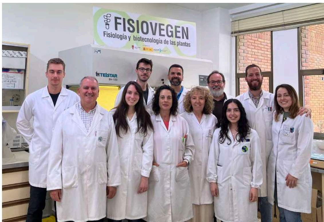
Figura 5. Miembros del GID Savia Sabia y colaboradores.