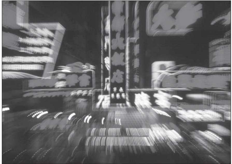
El Distrito de Wanchai por la noche.

boxeo de los Wu. La familia estableció un sólido punto de apoyo en Hennessy Road en Wanchai, un suburbio de Hong Kong.