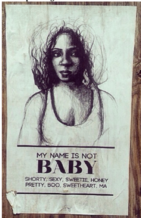
Stop Telling Women to Smile -2012