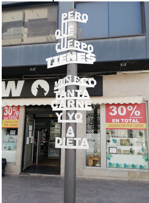
Alicia en el país de las maravillas - 2020