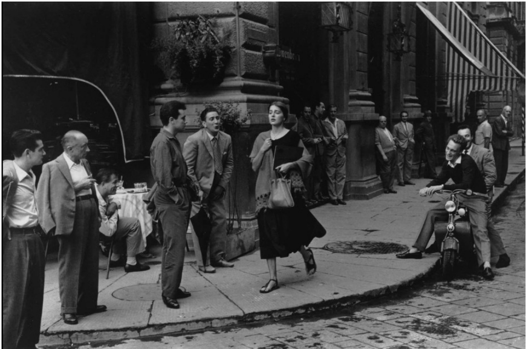
Imagen 2. An American Girl in Italy

En 1951, Ruth Orkin realizó en Florencia un reportaje fotográfico del cual la imagen más conocida es American Girl in Italy 9 (imagen 2).