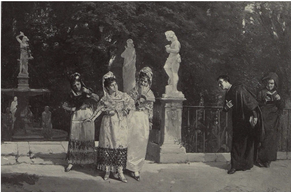
Fuente: Fotografía de Jean Laurent (1875), tomada de una ilustración de E. Estevan 6 .

En la imagen 1 se aprecia una representación decimonónica de la ‘galantería’ callejera, en la que un paseante con reverencia dirige un ‘halago’ a una mujer que parece aceptarlo con agrado, según se deduce de su lenguaje corporal. Las acompañantes de la piropoada la observan sin que podamos tener certezas de sus pensamientos, pero todos los signos indican que es una escena carente de tensión o amenaza. La ilustración representa una imagen costumbrista e idealizada que podría considerarse un producto promocional del piropo.