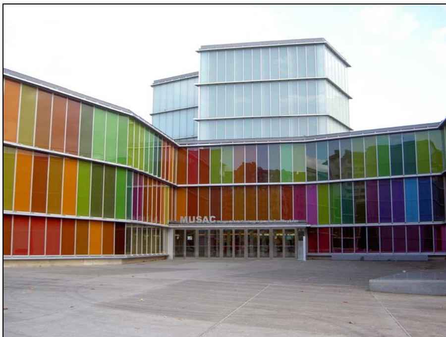
■ Fig. 1. Vista exterior del museo.

Y para concluir, respecto a la opinión, al público le ha gustado el museo en general, tanto en sus exposiciones, como por el edificio o por el servicio y atención recibida, mostrándose en su mayoría satisfecho. Sin embargo, hay sectores que han echado en falta algún tipo concreto de obras o una sala de exposición permanente con fondos de la colección estable del museo.