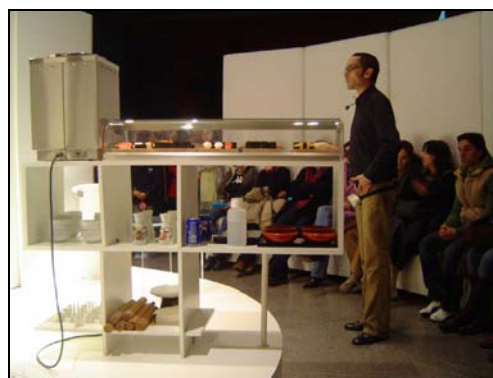
■ Fig. 3. Visita guiada de las exposición “Fusion: aspectos de la cultura asiática en la colección MUSAC”. D.E.A.C. MUSAC.