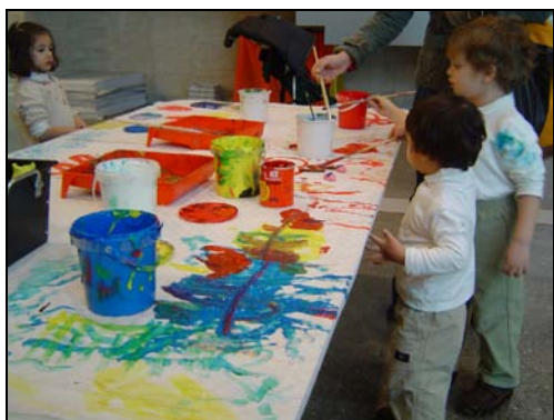
■ Fig. 4. Taller infantil. D.E.A.C. MUSAC.