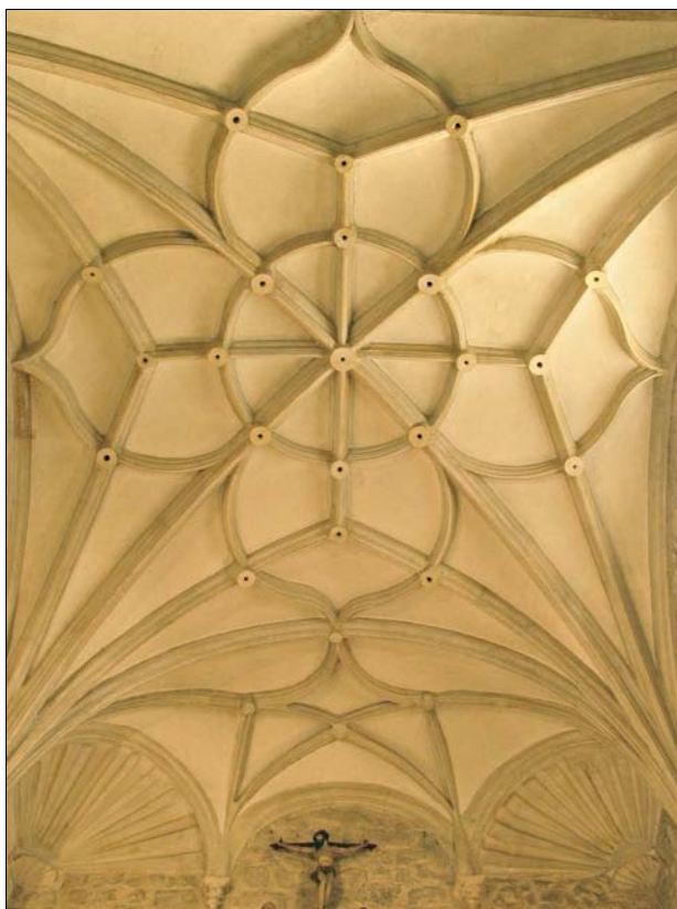
■ Fig. 3. Bóveda de la Capilla del Doctor Corral en la iglesia de La Magdalena de Valladolid