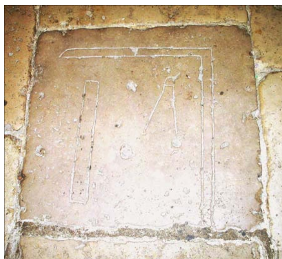
■ Fig. 4/5. Detalles del enlosado de la iglesia de Santa María de Mediavilla en Medina de Rioseco (Valladolid)