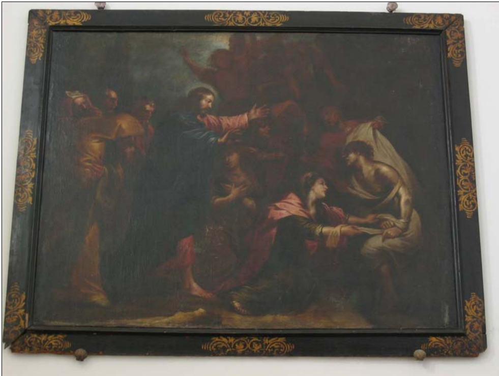
■ Fig. 3. Juan Antonio Escalante, Resurrección de Lázaro , c. 1669. Convento de Santa María de Carbajal.