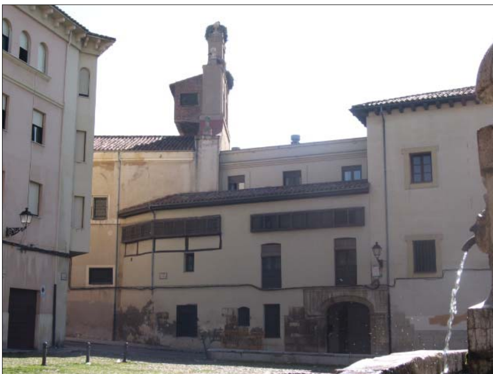
■ Fig. 2. Convento de Santa María de Carbajal (León).