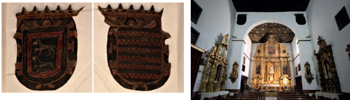
▪ Fig. 2. Blasones de los marqueses de El Carpio y vista de la capilla mayor de la iglesia del convento Jesús Crucificado (hoy residencia de ancianos San Rafael).

Por contra, la Casa de El Carpio presenta una observancia si cabe más continuada con Jesús Crucificado, como corresponde al tipo de patronato pleno. Hasta la invasión napoleónica, durante sus tres primeros siglos de existencia desarrollan una actividad de vigilancia y control que se observa tanto en el cumplimiento de sus obligaciones patronales como en las contraprestaciones que habrían de recibir por parte de este cenobio. No solo estuvieron atentos a construir y dotar convenientemente la iglesia, coro, capilla mayor y torre campanario con sus campanas, sino también su enfermería como vivo recuerdo del origen hospitalario de la fundación.