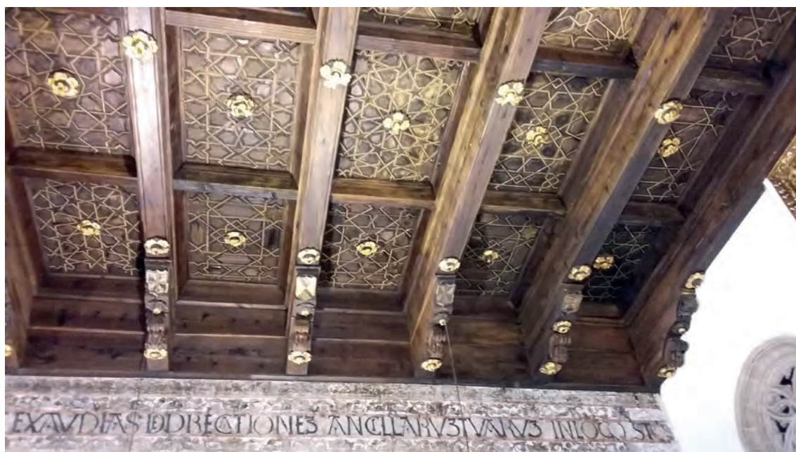
▪ Fig. 1. Alfارje del coro con armas del matrimonio fundador en sus ménsulas. Convento de Madre de Dios de Baena.

palia mediante la incorporación sucesiva y la adaptación de casas vecinas o construyendo en el espacio destinado a huerto las casas llamadas celdas, por lo general sufragadas por las familias para facilitar el ingreso en el claustro de distintas sores del mismo linaje. Resulta significativa la incidencia que para la conformación del inmueble conventual –y por ende del urbanismo de la localidad– tiene la incorporación de esas casas aledañas en concepto de celdas, las que tras el tapiado de ventanas y puertas exteriores se unen a la clausura mediante la apertura de vanos en las medianerías. Un fenómeno del que participan la inmensa mayoría de conventos de monjas contemplativas de cualquier orden, tanto en España como en Latinoamérica, dado que como nos refiere Fernando Benítez: