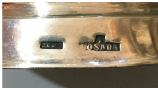
▪ Fig. 1. Detalle de la marca de artífice «J/LOSA-DA» (José Losada) en un cáliz. Santa María de Vilariño (Vilasantar).

con su inicial y uno de sus apellidos, o una abreviatura del mismo (fig. 1). Son frecuentes en Compostela a lo largo de todo el siglo XIX, mucho más que el resto de marcas. Sin embargo, pensamos que este rasgo tiene que ver más con la propia intención del artista de firmar su obra que con certificar la calidad como parte de una medida gremial o consistorial de carácter legal.