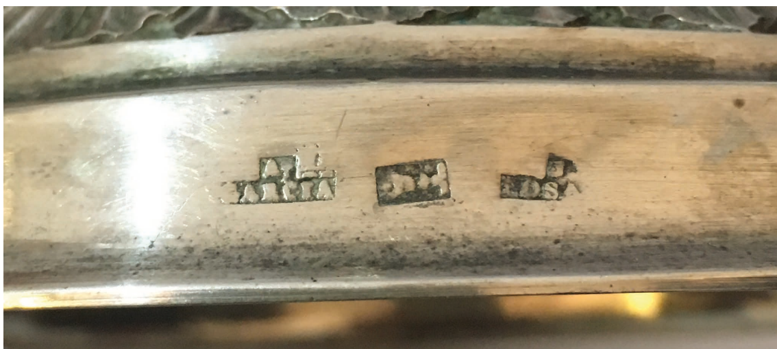
▪ Fig. 8. Detalle de las marcas, «J/LOSADA» (José Losada), «A/GARCIA» (Antonio García), y cáliz en un cáliz. Mediados del siglo XIX. San Martiño de Calvos de Sobrecamiño (Arzúa).

múdez en San Martiño Pinario (Santiago de Compostela) 80 , y dos cálices de Bermúdez en Santo Tirso de Manduas (Silleda) y Santa María de Silleda (Silleda) 81 .