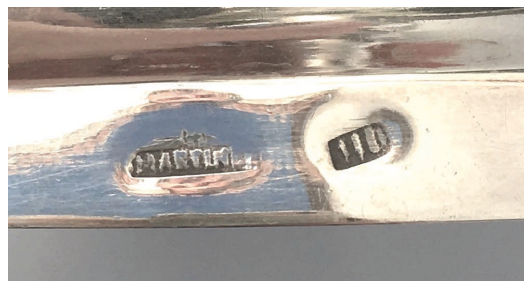
▪ Fig. 5. Detalle de la marca «IID» (once dineros) en un cáliz. 1911. San Breixo de Foxás (Touro).

traste 22 . Esto denota un interés personal del propio platero por dejar impresa en la pieza no solo su firma sino la marca que certifica la calidad material de sus obras. También este platero incluyó en alguna ocasión la marca “916”, indicando directamente el porcentaje de milésimas de plata por gramo, o cuando utilizaba plata de ley más baja, “900”.