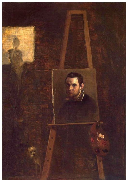
▪ Fig. 8. Annibale Carracci. Autorretrato sobre caballete, c. 1604. Hermitage, San Petersburgo.

el Salone , pero estos proyectos nunca pudieron llevarse a cabo.