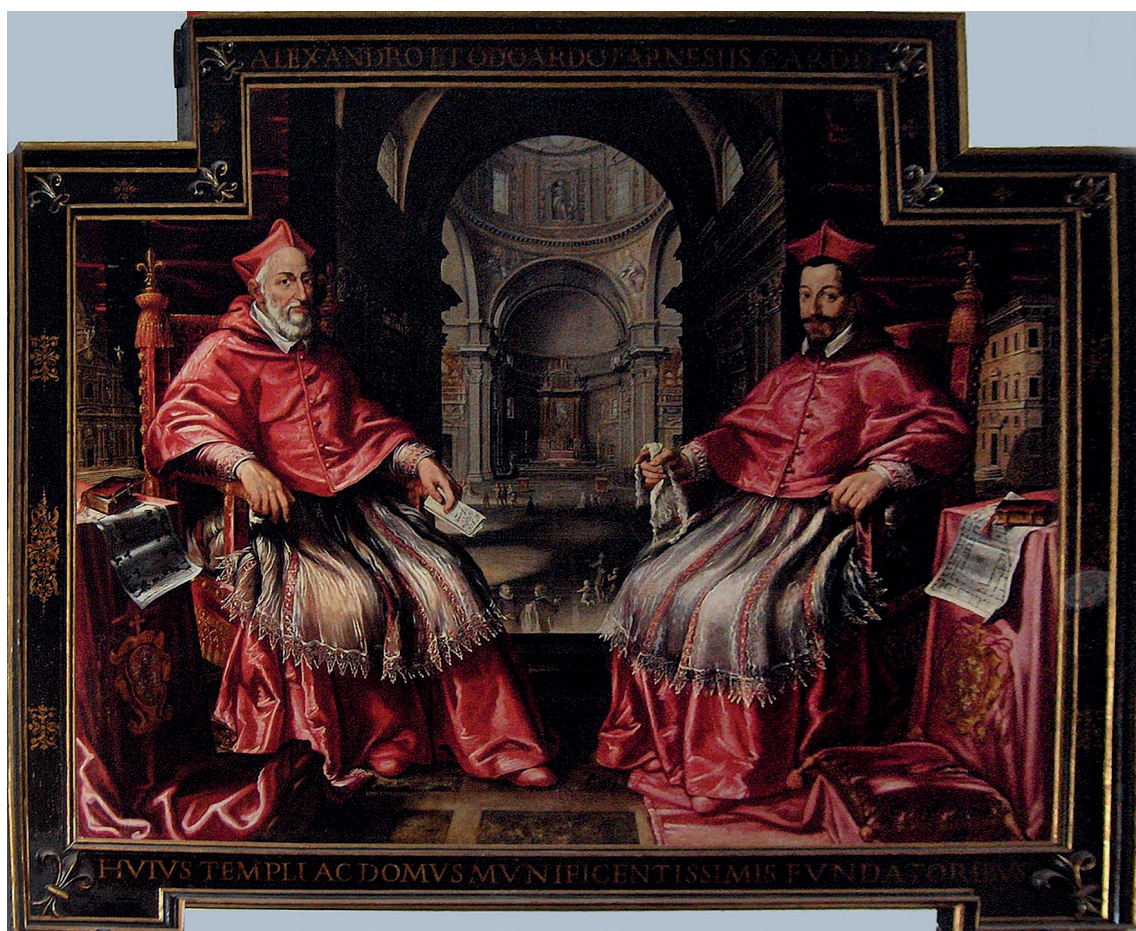
▪ Fig. 2. Anónimo. Cardenales Alessandro y Odoardo Farnese, c. 1610. Iglesia del Gesù, Roma.

duque de Parma, un gran héroe militar de las guerras contra los Países Bajos muerto en campaña. Destinado desde un inicio a una carrera eclesiástica, Odoardo recibió una cuidada educación, primero bajo la dirección del letterato Gabriele Bombasi (1531-1602), uno de los primeros mecenas de los Carracci y, posteriormente, también de Fulvio Orsini, el anticuario y bibliotecario de los Farnese, propietario de una extraordinaria colección de obras de arte. Odoardo había sido creado cardenal en 1591 por Gregorio XIV Sfondrati (1590-1591) 21 , cuya familia era estrecha aliada de los Farnese 22 .