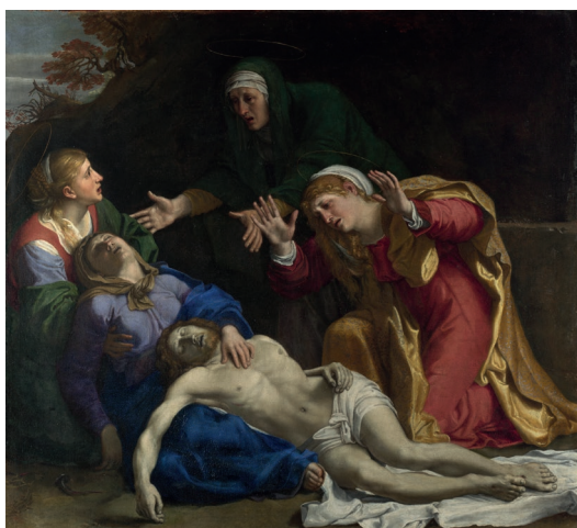
▪ Fig. 10. Annibale Carracci. Pietà (Las Tres Marías), 1603-1606. National Gallery, Londres.