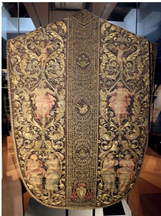
▪ Fig. 4. Annibale Carracci (diseño). Casulla, 1597-1600. Museo dell'Opera del Duomo, Florencia.

hacen, en el otro lado de la composición, María Magdalena y San Hermenegildo. Al fondo aparece la basílica de San Pedro. La presencia de San Eduardo ha llevado a algunos investigadores a vincular la pintura con el deseo de Odoardo de abandonar el cardenato, y con sus aspiraciones a ocupar el trono de Inglaterra cuando muriera Isabel I (1603), última reina de la dinastía Tudor. El cardenal Pietro Aldobrandini (1571-1621), sobrino del papa Clemente VIII (1592-1605), ordenó negar la candidatura de los Farnese al trono inglés. Al mismo tiempo que Odoardo donaba esta obra a la ermita de Camaldoli, también donó a este recinto eclesiástico una casulla (Fig. 4) y un antependio que ahora se encuentran en el Museo dell'Opera del Duomo de Florencia, los cuales fueron diseñados por Annibale 23 . El hecho de que Odoardo empleara a su artista para diseñar bordados y metalistería, así como obras monumentales, refuerza la contemporánea descripción de la "servidumbre" del pintor boloñés.