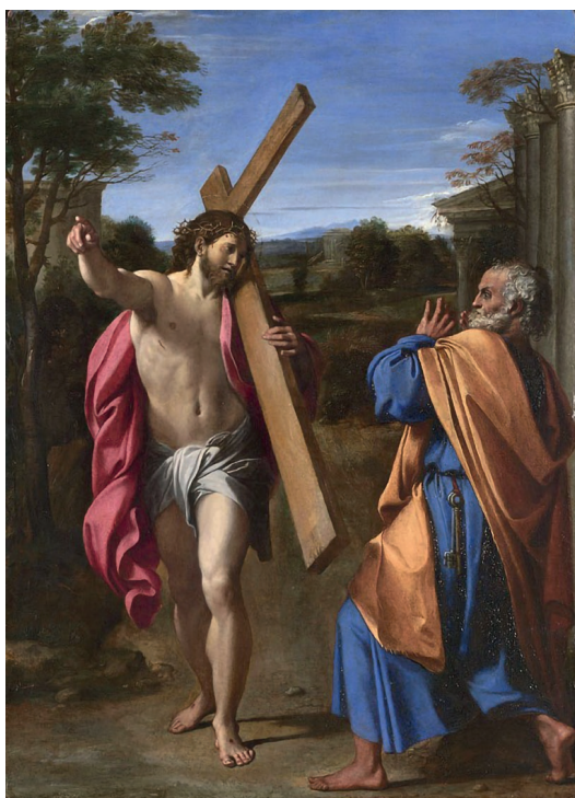
▪ Fig. 6. Annibale Carracci. Domine, Quo Vadis? , c. 1601. National Gallery, Londres.

dadas las amargas circunstancias en las que se separaron, ya que, a partir de su llegada a Roma, se intensificaron las disputas entre los dos hermanos, a las que sus biógrafos del siglo XVII hicieron referencia en varias ocasiones. Annibale reprochaba a Agostino su pedantería, su pretenciosidad, sus aires de cortesano y su actividad mundana que derivaba en continuas visitas de sus conocidos que impedían la concentración en el trabajo que el carácter de Annibale requería 54 . Otro duro golpe fue la muerte de su madre poco después, el 29 de mayo de 1602 55 .