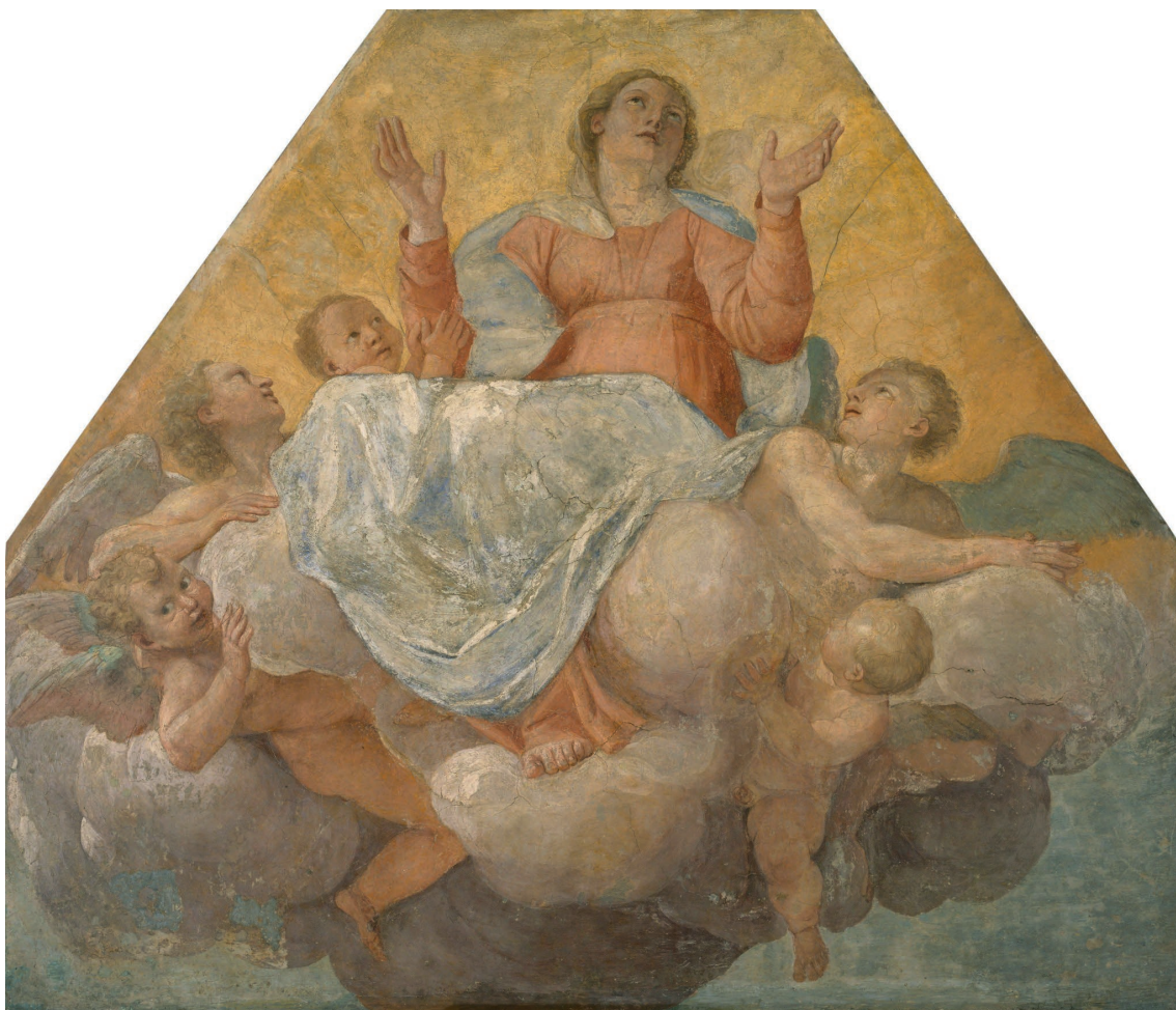
▪ Fig. 9. Annibale Carracci y Francesco Albani. Asunción de la Virgen, 1604-1605. Museu Nacional d'Art de Catalunya, Barcelona.

“Ni limpio, ni bien vestido, con su cuello torcido, su sombrero puesto deprisa y de cualquier manera y su barba desgredada, parecía un filósofo clásico, abstraído y solo” 68 . El difícil carácter de Annibale, con tendencia a la depresión, se ha configurado a partir de numerosos testimonios contemporáneos y también a través de algunos de sus autorretratos, que muestran a un hombre cada vez más desesperado 69 . “Los autorretratos tardíos, permiten medir su amarga desilusión (...) al servicio de un cardenal ambicioso y prepotente como Odoardo Farnese, que, en