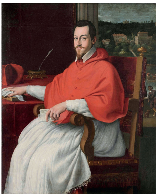
▪ Fig. 1. Domenico Zampieri, conocido como Domenichino. Odoardo Farnese, c. 1602-1603. Colección privada, Pesaro.

creativa por la que no recibió la merecida recompensa económica y afectiva por parte de quien fuera su principal comitente tras su traslado definitivo a Roma en 1595: el cardenal Odoardo Farnese (1573-1626).