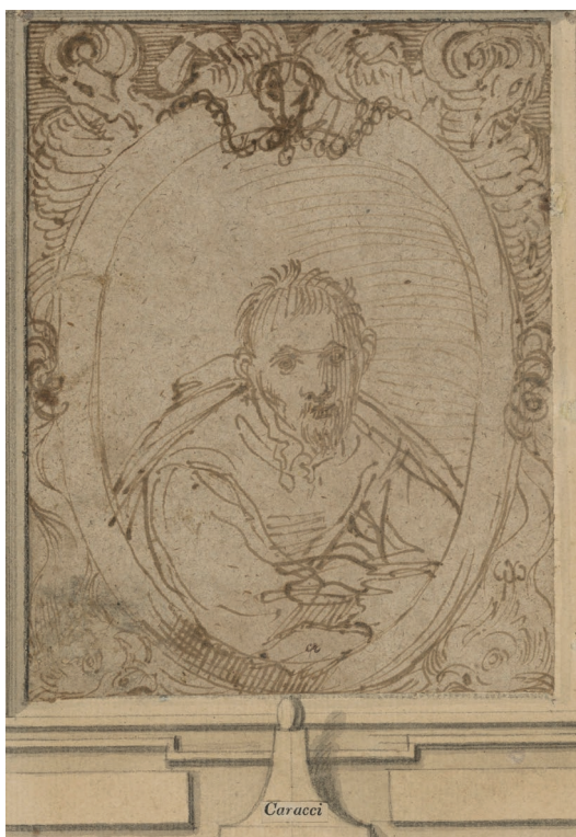
▪ Fig. 7. Annibale Carracci. Autorretrato, c. 1600. The J. Paul Getty Museum, Los Ángeles.