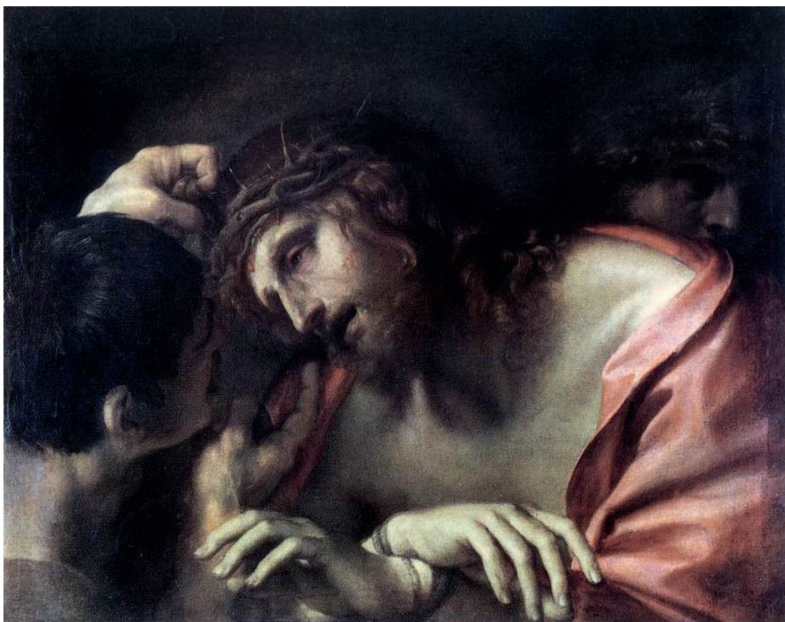
▪ Fig. 12. Annibale Carracci. Cristo escarnecido, 1596-1598. Pinacoteca Nazionale, Bolonia.