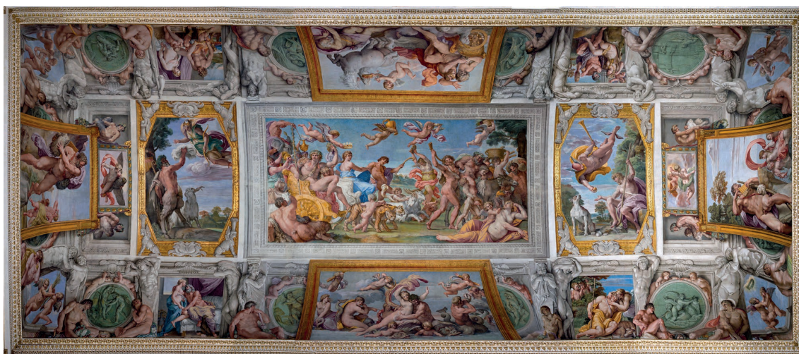
▪ Fig. 5. Annibale Carracci. Bóveda de la Galleria Farnese, 1597-1600. Palazzo Farnese, Roma.

escenas de las gestas de su padre, el duque Alessandro, este encargo nunca se llegó a realizar, sin que se hayan podido precisar los motivos. En su lugar, Annibale recibió el encargo de decorar otras dos estancias del palacio: el Camerino y la Galleria , cuyos frescos en bóveda y paredes acabarían convirtiéndose en su gran obra maestra. La bóveda de la Galleria Farnese fue “oficialmente” inaugurada en mayo de 1601 34 . Hay pocos precedentes en la pintura del Cinquecento romano para el programa decorativo de Annibale en términos tanto de forma como de contenido. Nada tan complejo había sido pintado desde los frescos de la Capilla Sixtina de Miguel Ángel, y, desde luego, no había nada comparable en un contexto secular 35 . Annibale creó un entorno completamente apropiado para la exhibición de obras de arte. Su obra maestra es un canto a los amores de los dioses y a la omnipotencia del amor ( Omnia vincit Amor ), además de una sofisticada meditación sobre el debate del paragone 36 y una de las pinturas al fresco más espléndidamente