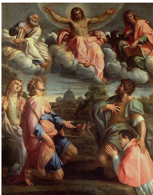
▪ Fig. 3. Annibale Carracci. Cristo en Majestad con Santos, c. 1597-1599. Palazzo Pitti, Galleria Palatina, Florencia.