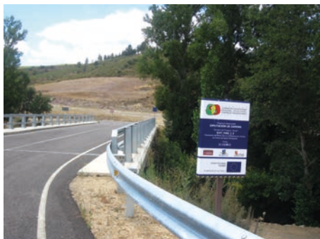
Imagen 4. Almeida/Ciudad Rodrigo (Salamanca). El desarrollo del proyecto “Plan de Mejora de la Competitividad y Sostenibilidad Turística del espacio rayano hispano-luso” (0554_COMSOTUR_II_3_E) pretende impulsar la puesta en valor de productos turísticos comunes.

Imagen 3. Figueruela de Arriba (Zamora)-Petisqueira. Con el proyecto Conexión de las áreas fronterizas para una mejor permeabilidad (0247_VIAS_2_E) se ha financiado el Puente Internacional sobre el río Manzanas/Maçãs en la carretera ZA-P-2438 que se inauguró el 12 de mayo de 2013.