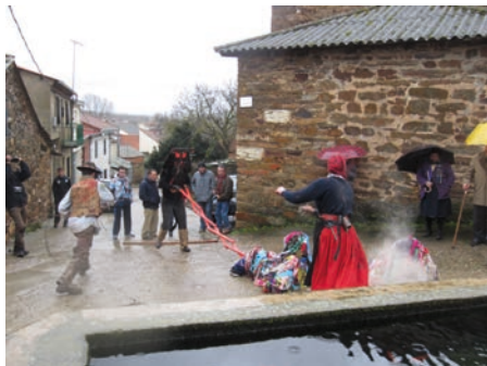
Imagen 2. Bragança. El Museu Ibérico da Máscara e do Traje es una de las actuaciones del proyecto MÁSCARA/SP2.P49/03, financiado en la tercera convocatoria de INTERREG III-A.

Imagen 1. Abejera de Tábara (Zamora). “Los Cencerrones” (1 de enero). El proyecto Máscaras trata de poner en valor y promocionar este patrimonio cultural inmaterial en ambos lados de la Raya.