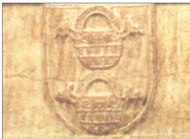
Figura III – Promenor das armas dos Pachecos (in Memória de Portugal... , p.175)