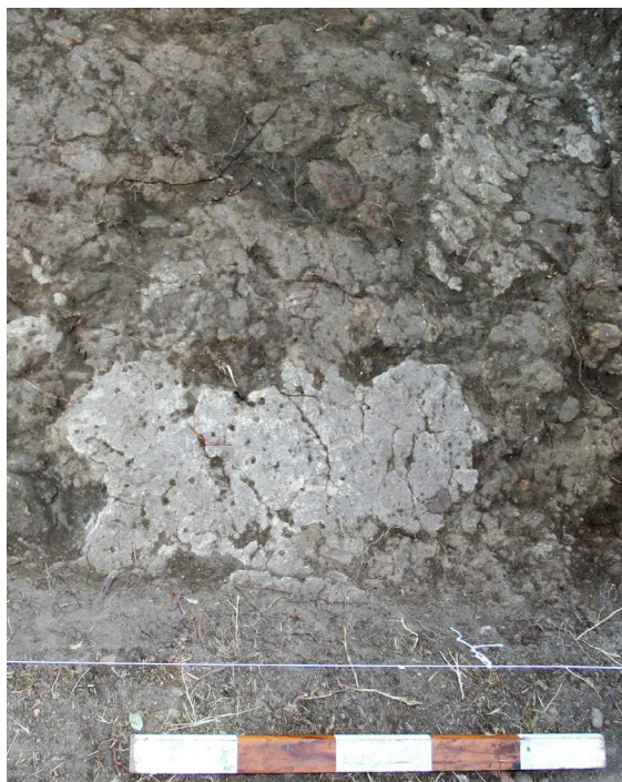
Figura 13. Superfície superior do pavimento (UE 409) detetado na sondagem 99V, na campanha de 2010.