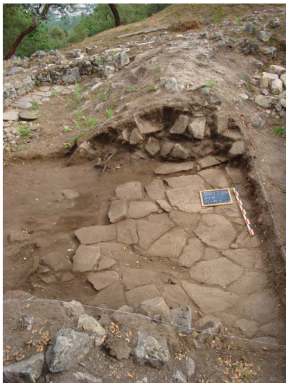
Figura 7. Lajeado (UE 203) registado na sondagem 97V, sob a camada de aterro resultante de anteriores escavações.