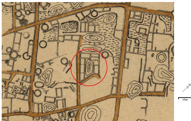
Figura 4. Representação da “Casa de Avscvs” no levantamento topográfico de 1892 (da autoria de Álvaro de Castelões), no qual se registou o aterro cobrindo o pátio interior. Original na Biblioteca Nacional de Portugal.

iríamos desenvolver os nossos trabalhos num espaço doméstico de um povoado proto-histórico para o qual procurávamos uma definição cronológica mais precisa e uma, se possível, clarificação de espaços funcionais. Este afastamento prévio em relação a uma definição digamos que “tradicional” prende-se com a discussão, ainda pertinente, da cronologia das construções de planta retangular, das quais se conhecem exemplares comprovadamente construídos na Idade do Ferro 10 . Está também relacionada com esta questão a existência, igualmente comprovada, de casas oblongas ou “retangulares com cantos arredondados” em contextos anteriores ao período romano Alto-imperial.