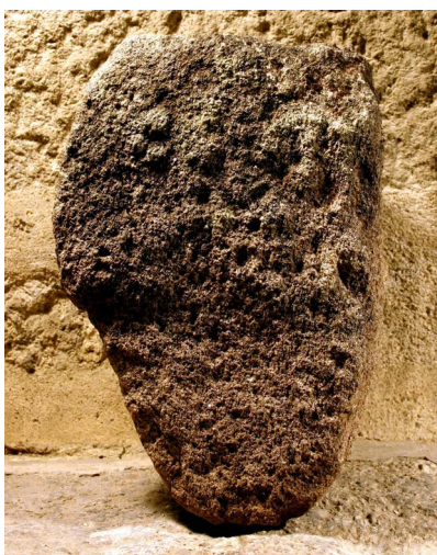
Figura 11. Elemento arquitetónico com epígrafe latina: Aus[ci?] (REDENTOR, 2011, vol. II: 133).

A sondagem 99V foi aberta numa área abrangendo o interior de um dos compartimentos que rodeavam o pátio, precisamente o compartimento fundeiro, cujo acesso se encontrava centralizado em relação ao pátio (Figura 12). Esta sondagem