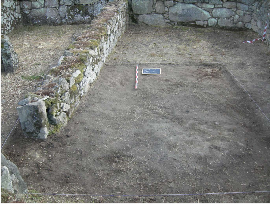
Figura 12. Plano inicial da sondagem 99V, localizada no interior de um compartimento da “Casa de Avscvs”, abrangendo a porta que abre para o pátio.

abrangeu também uma pequena parte exterior ao compartimento em questão. Foram registadas as seguintes atividades estratigráficas por ordem de escavação: