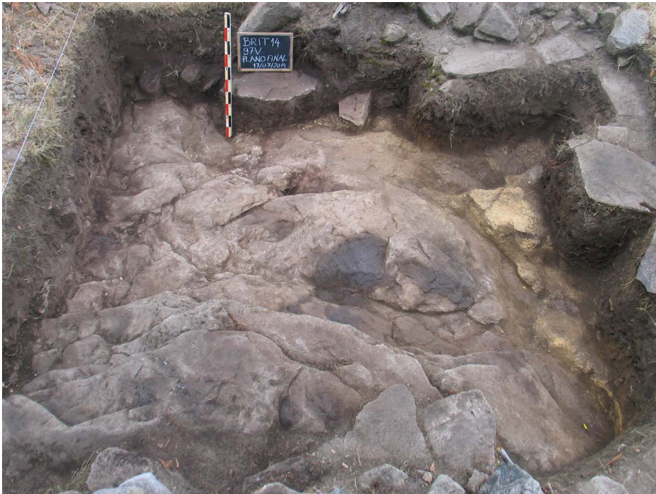
Figura 9. Plano final da sondagem 97V, mostrando a rocha-mãe, que se encontrava recoberta por estratos de regularização.

Face ao exposto, a escavação desta sondagem, cuja decapagem atingiu o substrato geológico (Figura 9) revelou algumas surpresas. Em primeiro lugar, a identificação de vários elementos arquitetónicos entre o amontoado de pedras que formavam o aterro do século XIX. Entre estes elementos destaca-se uma prisão de gado que, curiosamente, tinha sido fotografada in situ por Martins Sarmento (Figura 10), após o que acabou por ir parar ao aterro. Destaca-se também um bloco afeiçoado, que terá integrado uma parede, com uma epígrafe muito erodida, na qual se lê o nome AVSCVS 13 (Figura 11). Em segundo lugar, a própria existência do pavimento lajeado. Desconhecia-se, de facto, que tipo de pavimento teria tido este pátio, tendo em conta a sua configuração atípica em relação às restantes unidades habitacionais. Em terceiro lugar, a existência de uma estrutura de combustão prévia à construção deste pátio, sem que se tenha detetado qualquer outra construção, que presumimos totalmente arrasada, ou mesmo inexistente.