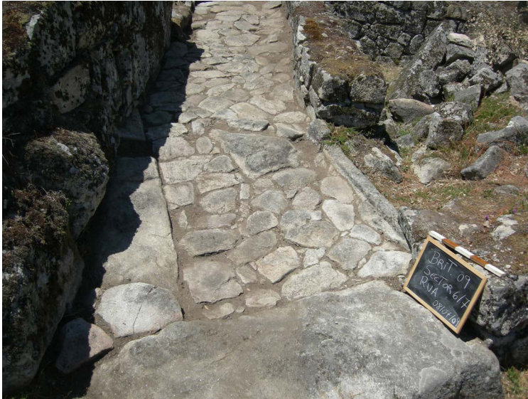
Figura 18. Soleira da porta de acesso à “Casa de Avscvs ” a partir da via pública.

O proprietário desta casa, que poderia ter-se chamado Avscvs , seria um indígena, hipótese reforçada pela origem local deste nome 17 . Mas um indígena membro da aristocracia local que, negociando com o poder romano, quiçá enriquecendo com ele, adota a escrita alfabética latina ao gravar o seu nome na parede da casa, adota o numerário, possuindo dinheiro, e adquire vistosas louças finas importadas, que conhecemos como Terra Sigillata .