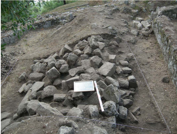
Figura 6. Aterro do século XIX (UEs 200, 201 e 202) registado na sondagem 97V.