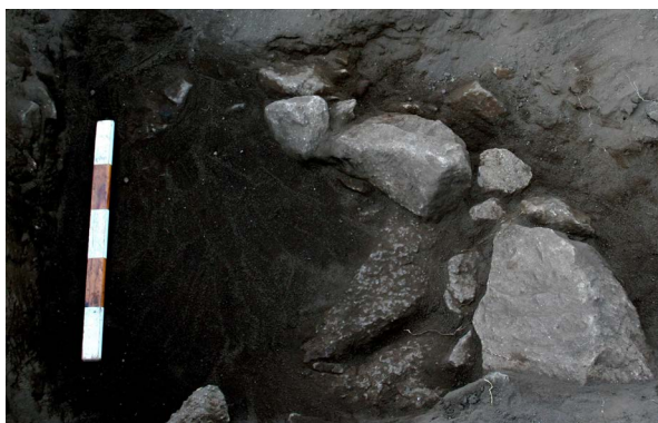
Figura 8. Estrutura de combustão (UE 215), localizada na sondagem 97V.