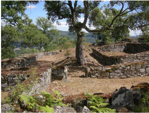
Figura 2. Vista parcial da “Casa de Avscvs” (Unidade Habitacional 3, do Sector 7), antes do início dos trabalhos. Fotografia de 2008.

se usa chamar um conjunto “de tipo domvs ” 7 . Ainda que esta diferença possa não corresponder necessariamente a distintos períodos de construção, a opção por cânones arquitetónicos completamente diferentes terá subjacente uma distinta visão do espaço, da funcionalidade e do conforto por parte dos seus construtores. Implica mesmo uma nova ideia de casa, em relação aos conjuntos formados por construções redondas características do mundo dos castros.