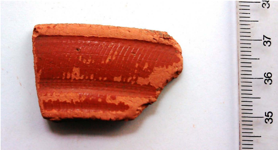
Figura 16. Fragmento de bordo de taça em Terra Sigillata de produção hispânica (sondagem 97V, UE 204).

bronze e vários fragmentos indeterminados de ferro, bem como, a nível de material orgânico, uma considerável quantidade de bolotas carbonizadas, nos níveis associados à estrutura de combustão existente por debaixo do lajeado do pátio.