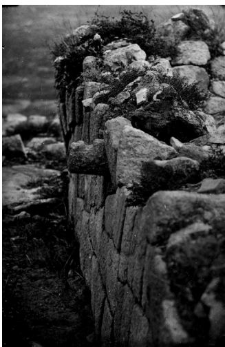
Figura 10. Prisão de gado colocada sobre um muro, no século XIX. Objeto reencontrado na campanha de 2009, na “Casa de Avscvs ”.