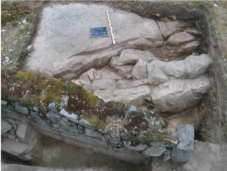
Figura 14. Plano final da sondagem 99V. Distingue-se o corte (UE -417) efetuado para implantação do muro do compartimento (UE 404), bem como uma área de rocha aplanada, que terá sido usada como pavimento.

A escavação desta sondagem não revelou, propriamente, dados inesperados, além do facto de o pavimento lajeado do pátio não ter sido feito até ao limite da parede fundeira, o que revela a existência de uma zona coberta, ao fundo do pátio, com um pavimento em saibro.