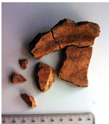
Figura 15. Fragmentos de prato de cerâmica romana de fabrico comum (achado 1, UE 407), recolhidos no interior do compartimento, na sondagem 99V.

século I a. C. 14 , mas misturados com cerâmicas datáveis de um contexto posterior. Foram recolhidos fragmentos de ânfora Haltern 70, como é habitual em estratos escavados na Citânia de Briteiros, cuja importação se iniciou a partir de meados do século I a. C. 15 . Foram recolhidos vários exemplares de cerâmica comum romana, correspondente ao período que medeia entre os finais do século I a. C. e o século I d. C. 16 . Destaca-se aqui um fundo de prato (Figura 15) recolhido num nível superficial da sondagem 99V, acima do pavimento original, o que pode dar uma ideia dos materiais existentes nos níveis de ocupação da casa, removidos no século XIX.