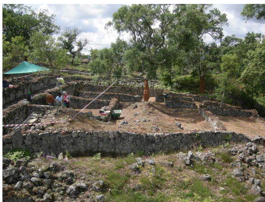
Figura 3. Vista de conjunto da “Casa de Avscvs ”, durante os trabalhos de 2008.

Pelo que já referimos, a “Casa de Avscvs ” (Figuras 2 e 3) foi, assim, definida como uma área estratégica do ponto de vista das escavações arqueológicas por se tratar de um caso atípico em relação à arquitetura doméstica que prolifera no povoado e por confrontar diretamente com um dos arruamentos ortogonais do oppidum , sendo portanto um ponto particularmente interessante para se analisar a relação entre o traçado e construção das ruas e a construção e utilização das unidades familiares, em momentos distintos. Uma terceira razão que justificou a intervenção neste espaço é o facto de o pátio interior da “Casa de Avscvs ” ter sido, na sua maior parte, ocupado por uma escombreira resultante das escavações do século XIX (Figura 4). Se em alguns pontos do monumento se torna praticamente impossível apurar a proveniência das terras das escavações antigas, as terras desta escombreira provêm, sem grandes dúvidas, dos níveis de ocupação e de abandono dos compartimentos que rodeiam o pátio. Este fator pode, de facto, auxiliar, de forma relativa, uma datação da utilização desta casa, em função dos materiais arqueológicos existentes no aterro central.