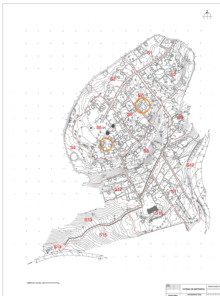
Figura 1. Planta da área escavada da Citânia de Briteiros, com divisão dos sectores de estudo. Os círculos indicam a “Casa da Espiral”, à esquerda (sector 5) e a “Casa de Avscvs”, à direita (sector 7). Levantamento da Infotop. Vectorização da Unidade de Arqueologia da UM.

Um outro critério seguido nas campanhas desta última década foi a ideia de estudar comparativamente duas unidades domésticas com características arquitetónicas distintas, designadamente um complexo familiar formado apenas por construções circulares e um outro formado exclusivamente por construções angulares, o que