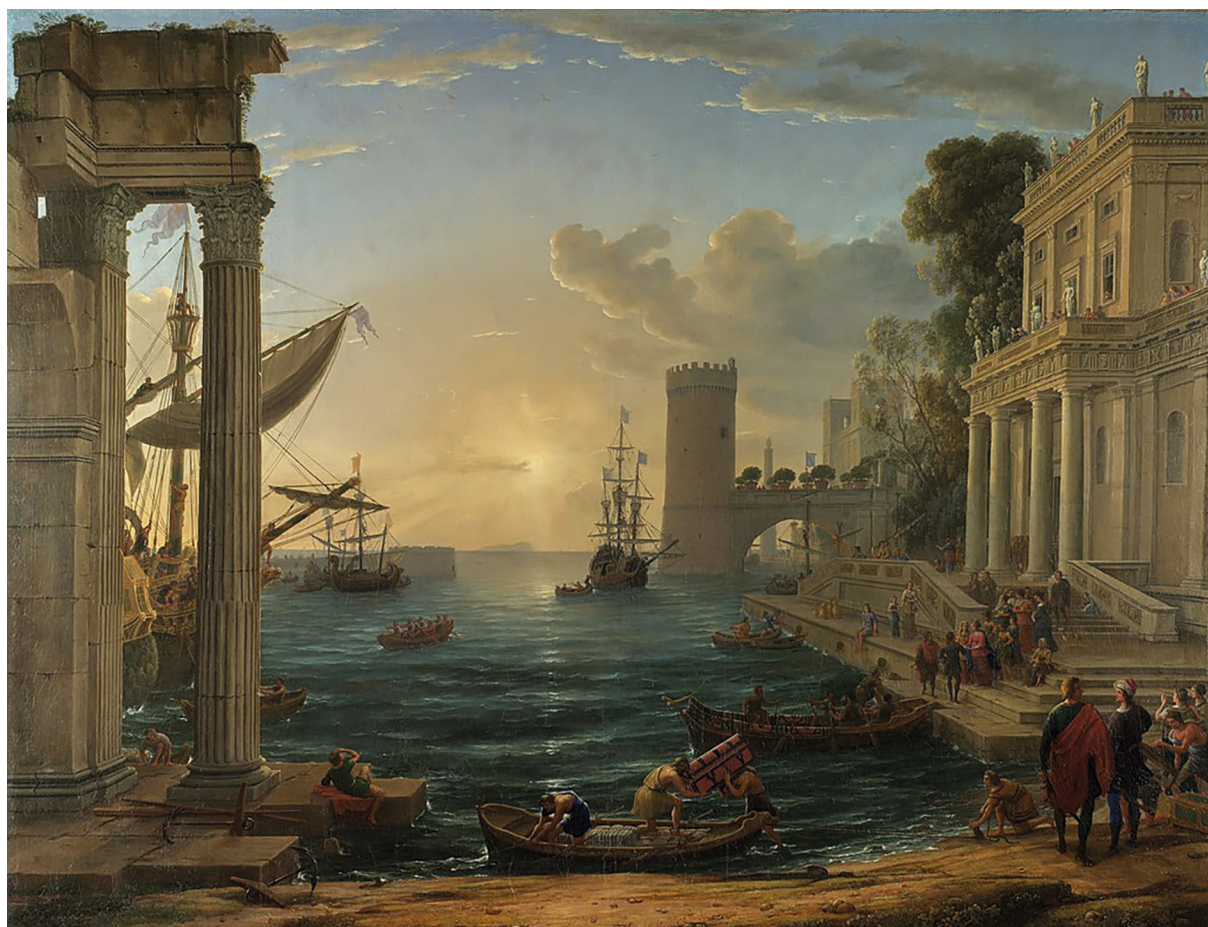
Fig 2. Claudio Lorena, Puerto con el embarque de la Reina de Saba , 1648, óleo sobre lienzo, 148 cm x 194 cm, Londres, National Gallery

Este género, surgido en la Roma de principios del Seiscientos de la mano de Annibale Carracci, solía representar un locus amoenus con la presencia de discretas figuras mitológicas, históricas o religiosas y algunos edificios de la Antigüedad perfectamente integrados en el marco natural 85 . Asimismo, la modalidad atendía con especial cuidado a perfilar los detalles de la luz y de la atmósfera. Para la visión de la costa y del mar, se pueden recordar especialmente algunos cuadros del pintor de la luz por excelencia, Claudio Lorena, como sus panoramas de puertos mediterráneos. Puede citarse, entre otros, el Puerto con el embarque de la Reina de Saba :