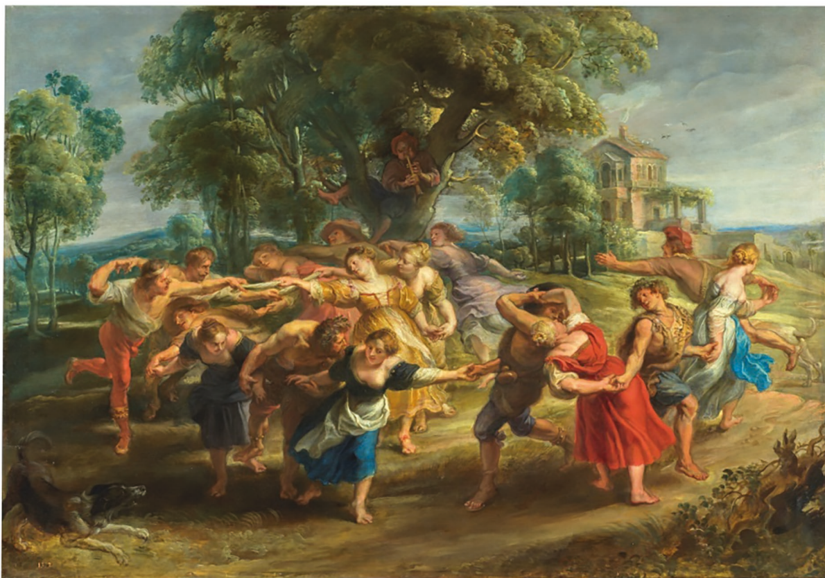
Fig. 1. Pedro Pablo Rubens, Danza de personajes mitológicos y aldeanos , 1630-1635, óleo sobre tabla, 73 cm x 106 cm, Madrid, Museo del Prado

El Sileno buscaba de aquellas que la sierra dio Bacantes, ya que Ninfas las niega ser errantes el hombro sin aljaba, o si del Termodonte, émulo del arroyuelo desatado de aquel fragoso monte, escuadrón de Amazonas desarmado tremola en sus riberas pacíficas banderas (vv. I, 271-280) 55 .