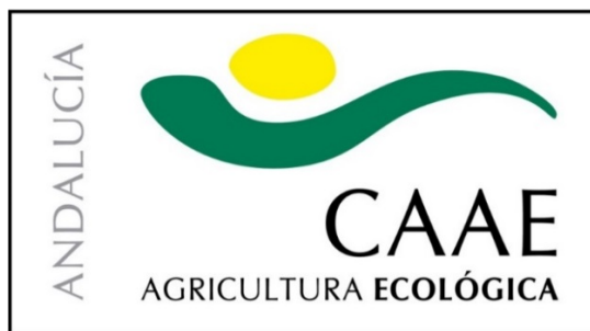
Figura 5. Etiqueta ecológica de Andalucía

Servicio de Certificación CAAE, S.L. y otros diez organismos más están autorizados para el control y certificación de los alimentos ecológicos.