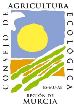
Figura 20. Etiqueta ecológica de la Región de Murcia

Región de Murcia: www.caermurcia.com/ (ES-ECO-024-MU) Consejo de Agricultura Ecológica de la Región de Murcia