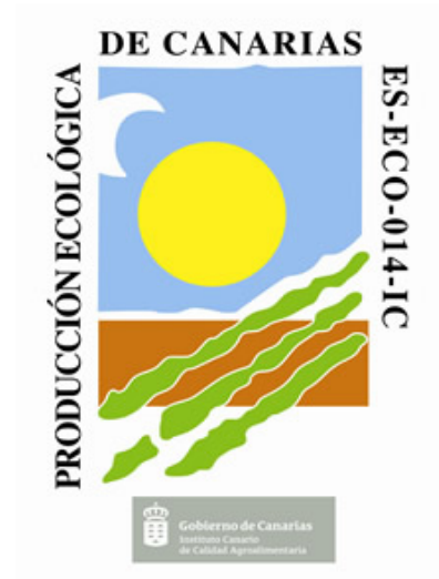
Figura 9. Etiqueta ecológica de Canarias

Canarias: www.gobiernodecanarias.org/agricultura/icca/agriculturaecologica (ES-ECO-014-IC) Instituto Canario de Calidad Agroalimentaria (ICCA)