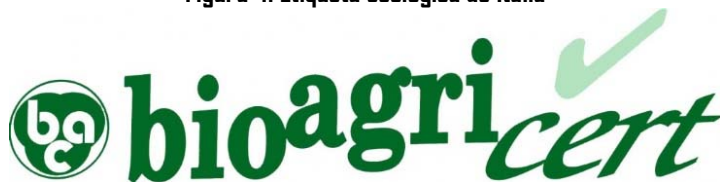
Figura 4. Etiqueta ecológica de Italia