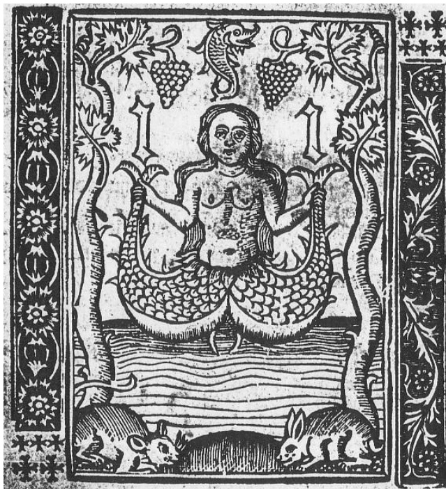
Ilustración con la que se concluye la obra