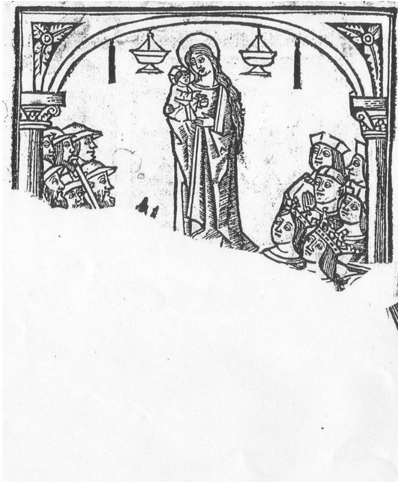
Inicio del Manual

Empieza el tratado con un problema resuelto por la regla de las dos falsas posiciones, pero en el segundo, el autor nos plantea acertadamente, que aunque dicho problema podría ser resuelto como el anterior por la regla de dos falsas posiciones, nos afirma que también se puede hacer por la regla de tres, muy fácil y sotilmente . A lo largo de los siguientes ejercicios desarrollados en este último tratado, el autor nos confirma que el análisis del problema es vital para su pronta solución y demuestra que no siempre el método convencional es el mejor para resolverlo. Hace alarde de la facilidad con que podemos llegar al resultado utilizando en cada caso el procedimiento idóneo para su solución.