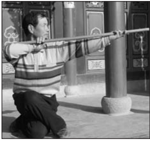
ARTISTA MARCIAL DE TIANSHUI DEMOSTRANDO LA FORMA DE PALO DEL LÁTIGO DEL TIGRE BLANCO.