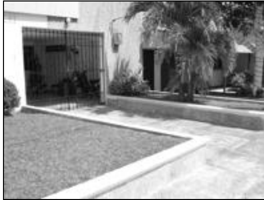
Figura 3 - Barrio Paraíso, Barranquilla - Colombia

Las casas en Paraíso se encuentran protegidas por rejas, como resultado de la delincuencia común que ronda el sector.