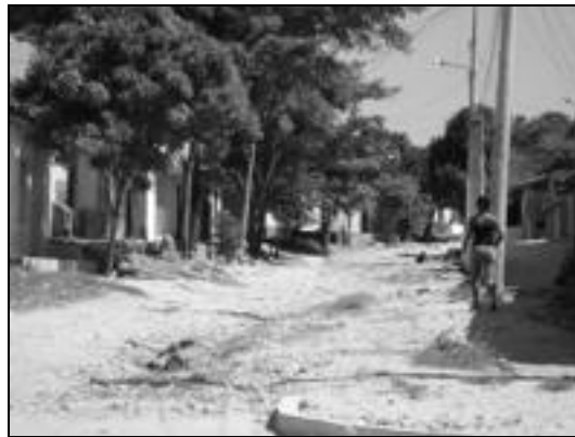
Calle de Los Lázaros en El Bosque. Sector controlado por una pandilla.