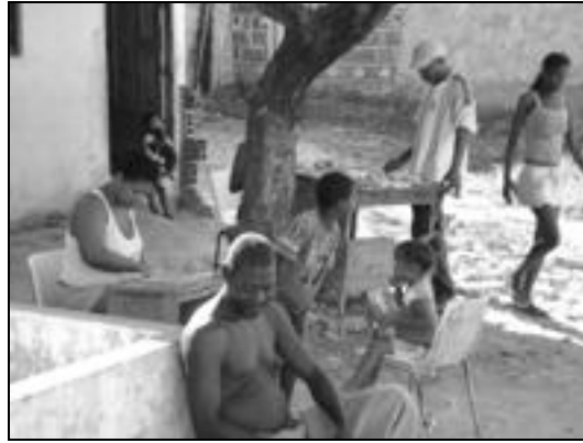
Comunidad Afrocolombiana en el barrio El Boque. Este es el lugar de las jóvenes de esta etnia en El Bosque.