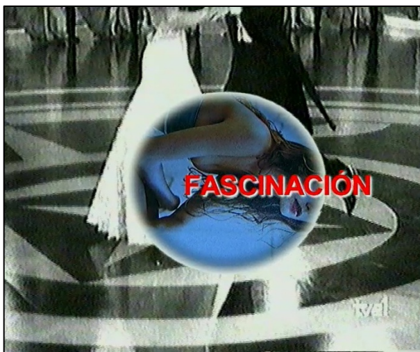
Figura 1. Erreakzioa-Reacción, La construcción de imágenes/imágenes de mujeres , 2001