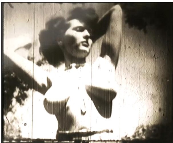
Figura 2. Eugeni Bonet, Spanish Deligh , 2007