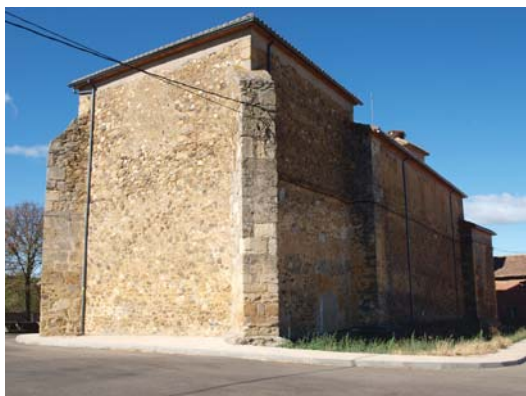
▪ Fig. 3. Vista exterior de la capilla mayor de la iglesia de San Miguel de Cubillas de Rueda.