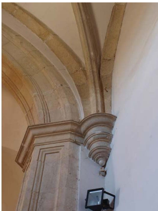
▪ Fig. 4. Detalle de una de las mesetas semicirculares sobre ménsula en el abovedamiento interior de la capilla mayor de la iglesia de San Miguel de Cubillas de Rueda.

maderos traídos desde la cercana localidad de Quintana del Monte, junto a clavos, clavijas y un pago por valor de ciento cincuenta y tres reales empleados en los cuarenta y tres jornales necesarios para el retejo y caedizo de la iglesia 39 .