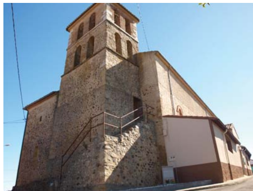
▪ Fig. 8. Vista exterior del baptisterio, torre y portal lateral de la iglesia de San Miguel de Cubillas de Rueda.

año 1998 con las labores de levantado y nuevo entablado de la cubierta y tejado, junto a la sustitución de las ventanas y pavimentos interiores (Fig. 8) 79 .