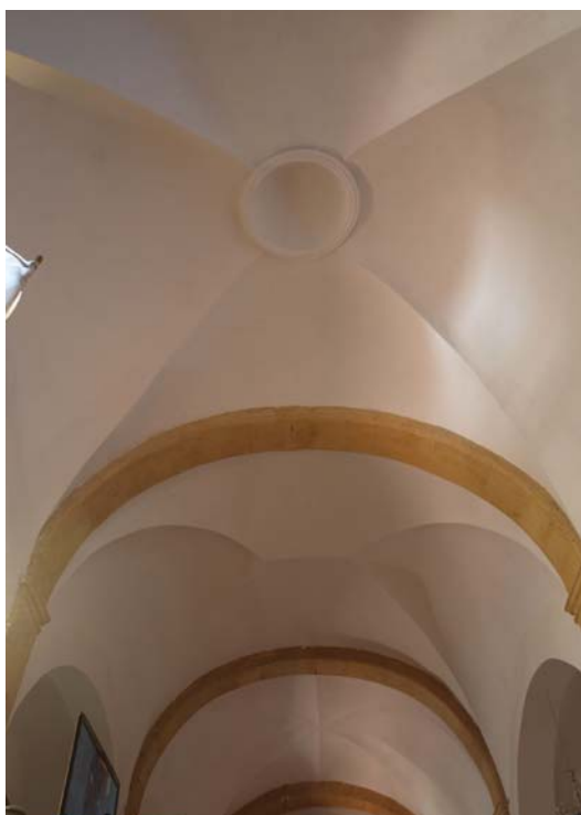
▪ Fig. 5. Abovedamiento de la nave de la iglesia de San Miguel de Cubillas de Rueda.