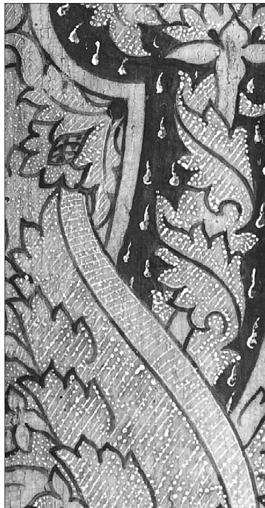
■ Lám. 7. Detalle de la figura 1.