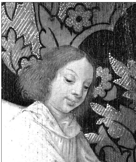
■ Lám. 6. Detalle de la figura 4.