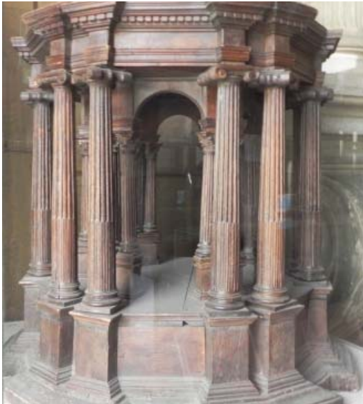
▪ Fig. 6. Primer cuerpo de la maqueta.

7). En la custodia de Ávila la estructura es semejante, con un entablamento corrido, pero al ir los remates de los espacios que forman las columnas por delante del mismo, y además con forma de torrecilla, queda oculto.