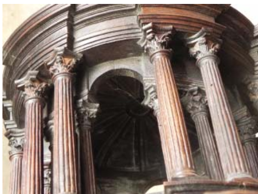
▪ Fig. 12. Detalle del interior del segundo cuerpo.

También destaca dentro de la calidad de la maqueta el detalle de la parte interior, mostrando cómo sería la cubierta de cada uno de los cuerpos (Fig. 12): unas cúpulas vaídas con motivos decorativos geométricos a base de placas que ocupan lo que fueran las aristas de una bóveda gótica, con un círculo central. No es modelo que coincida con ninguna de las tres grandes custodias de Arfe que han llegado hasta nuestros días. Sin duda, los motivos decorativos explican esa diferencia.