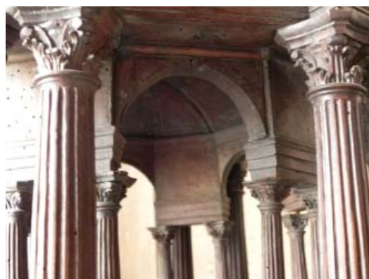
▪ Fig. 5. Detalle del tramo serliano, en el interior del segundo cuerpo de la maqueta.

Igualmente, la superposición de órdenes, que se utilizan en esta maqueta es otra de las recomendaciones de la Varia 24 . Éste sí que es un elemento que reitera en prácticamente todas las custodias de plata. En la de Ávila lo hace en los tres cuerpos inferiores, pero en los superiores emplea hermas, balaustres y pilas-tras. En Sevilla y Valladolid sigue el ideal teórico, al igual que en la desaparecida de Burgos, donde al menos en el contrato estaba previsto.