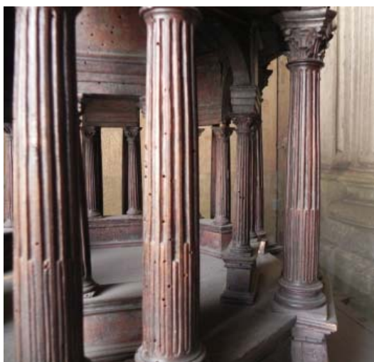
▪ Fig. 4. Doble columnata del 2º cuerpo de la maqueta.

Una primera columnata, la exterior, sigue las proporciones y órdenes que propone Arfe en su teoría; pero en la interior las proporciones se reducen, colocando las columnas sobre altos plintos y reiterando en todos los cuerpos el orden compuesto.