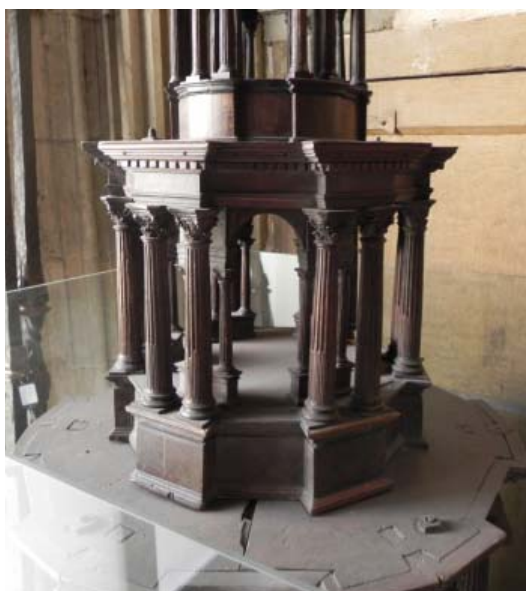
▪ Fig. 10. Tercer cuerpo de la maqueta.

El tercer cuerpo de la maqueta (Fig. 10) es el que presenta una planta más quebrada, pero en alzado reitera el modelo de los otros. Lo mismo ocurre en el cuarto que se remata con una cúpula semiesférica, sobre el que todavía aparece un último cuerpo de pequeñas dimensiones, igualmente columnado (Fig. 11).