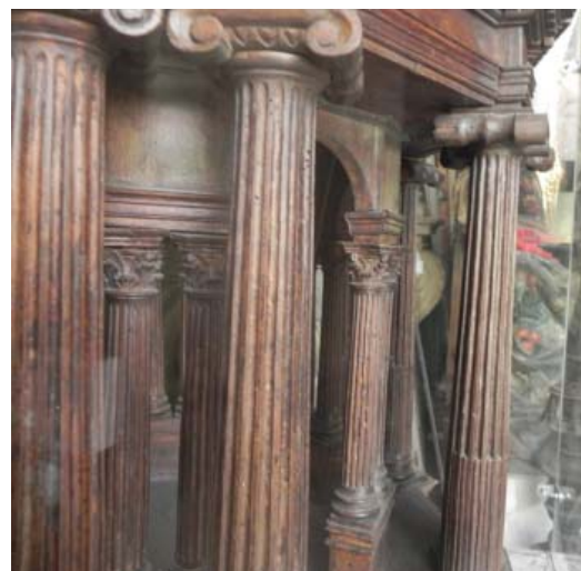
▪ Fig. 3. Detalle de la maqueta de la catedral de León: doble columnata del 1º cuerpo. Fotografía de la autora con permiso de la Catedral de León.

Otro elemento reiterado en cada uno de los cuerpos de la maqueta son dos círculos concéntricos de columnas (Figs. 3 y 4). Según señala la profesora Carmen Heredia la idea de la doble columnata se puede relacionar con un posible conocimiento por parte de Arfe del templete de San Pietro in Montorio a través de los dibujos de Libro III de Serlio 22 y que utiliza en la custodia de Sevilla. Tan sólo faltaría en esta maqueta inédita, la presencia de una balaustrada en el primer cuerpo, algo que sí que utiliza en la hispalense. La maqueta sevillana muestra esa misma disposición, e incluye incluso el remate por encima del primer cuerpo.