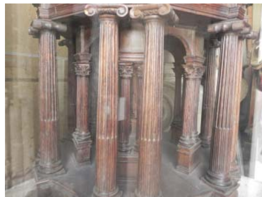
▪ Fig. 8. Segundo cuerpo de la maqueta.

Los alzados de los cuerpos segundo y cuarto de la custodia sevillana coinciden plenamente con los de la maqueta (Figs. 8 y 9), pues en aquellos se modifica respecto al cuerpo inferior el modo en que se quiebra el perfil curvo, haciéndolo en ambos del mismo modo que ocurre en toda la maqueta leonesa. El trozo de entablamento que descansa justo en la vertical de la columna sobresale también del perfil en el segundo cuerpo de la custodia de Ávila, pero en este caso la diferencia está en que no se utilizan pares de columnas. En Valladolid, el segundo cuerpo recurre también a esta misma estructura.