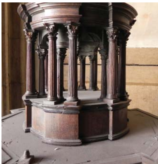
▪ Fig. 9. Cuarto cuerpo de la maqueta.

El tercer cuerpo de la maqueta (Fig. 10) es el que presenta una planta más quebrada, pero en alzado reitera el modelo de los otros. Lo mismo ocurre en el cuarto que se remata con una cúpula semiesférica, sobre el que todavía aparece un último cuerpo de pequeñas dimensiones, igualmente columnado (Fig. 11).