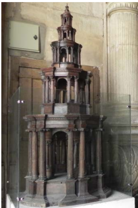
▪ Fig. 1. Catedral de León. Maqueta de custodia procesional, en madera.

En una de las capillas, no visitables, del claustro de la catedral de León, que hoy forma parte del Museo, se guarda una interesante pieza de madera, que responde a la tipología de custodia procesional (Fig. 1).