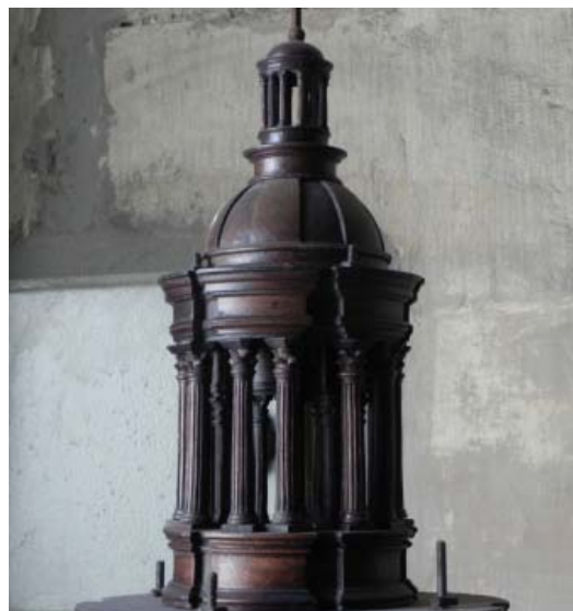
▪ Fig. 11. Cuarto cuerpo de la maqueta.

Como ya hemos indicado, en la maqueta leonesa no hay elementos decorativos, lo que permite observar con total pureza el modelo arquitectónico propuesto. Tan sólo destacan las cuidadas estrías de los fustes de columnas y las líneas de imposta que rematan el primer y segundo cuerpo. Las columnas de la custodia abulense van cambiando de orden, pero también de elementos decorativos en su fuste: el tercio inferior con grutescos y el resto estriado en el primer cuerpo; dos tercios, superior e inferior con grutescos en el segundo; estriados con anillos intermedios en el tercero; y hermes, siguiendo a la custodia de Medina de Rioseco de su padre, en el cuarto. En Sevilla, emplea unos fustes con grutescos en la primera planta, tercios superior e inferior con grutescos en la segunda y tercera, y estrías con anillos en el cuarto. En Valladolid, finalmente, no varía tanto, utilizando el modelo abulense, tan sólo eliminando los hermes del cuarto cuerpo, sustituidos por columnas estriadas. La documentación de la custodia de la catedral de Burgos arroja también ese uso de diferentes fustes, jugando con tercios labrados o estriados 28 .